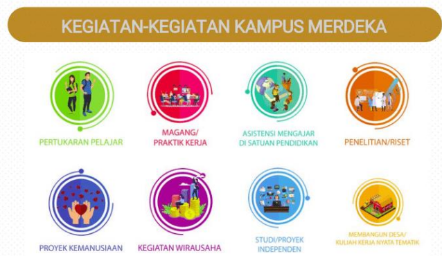
Gambar 1. Program-Program MBKM

Dengan memperhatikan hal tersebut di atas, Kemendikbud meluncurkan program 'Merdeka Belajar - Kampus Merdeka' atau yang dikenal dengan sebutan 'MBKM'. Program MBKM memungkinkan mahasiswa untuk praktek kerja di luar kampus dalam rangka membangun profil lulusan yang terkait dengan profesinya. Terdapat 8 (delapan) program MBKM yang bisa dipilih mahasiswa, seperti tersebut gambar di bawah ini,