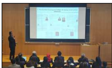
Kuliah internasional mahasiswa program doktor hukum dan doktor ekonomi di Wako University Jepang

Realisasi kerjasama diwujudkan juga dalam kegiatan bersama pada seminar Nasional/Internasional, konferensi Nasional/Internasional, kunjungan belajar dan beberapa kegiatan lainnya.