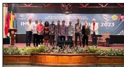
Indonesia Cyber Law Conference diselenggarakan oleh Program Pascasarjana Universitas Borobudur