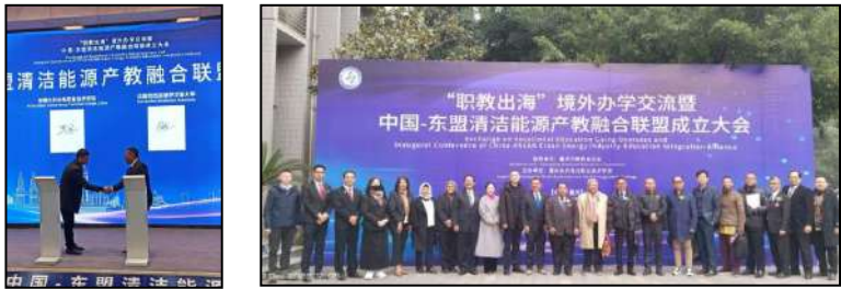
Gambar 2. Penandatanganan MoU di Chongqing

Dalam lingkup luar negeri, menjalin kemitraan dengan lembaga pendidikan dari luar negeri membawa sejumlah manfaat yang signifikan, mendukung pengembangan akademis, riset, dan prestasi global universitas di tanah air.