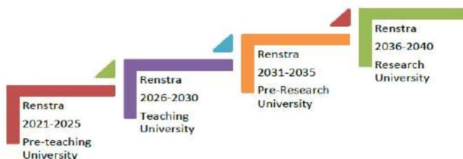
Gambar 1. Tahapan Rencana Induk Pengembangan Universitas Borobudur

Untuk mencapai visi 2040, Universitas Borobudur menyusun Rencana Induk Pengembangan (RENIP) yang dijabarkan dalam 4 (empat) tahapan Renstra 5 (lima), sesuai Gambar 1 tersebut di bawah ini.