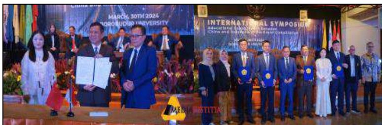
Gambar 3. Penandatanganan Kerjasama Internasional di Universitas Borobudur

perguruan tinggi mitra di luar negeri (China, Malaysia, India, Korea, Thailand). Realisasi kerjasama, ITEA-ICCCM China mendirikan Sekretariat ITEA di Universitas Borobudur.